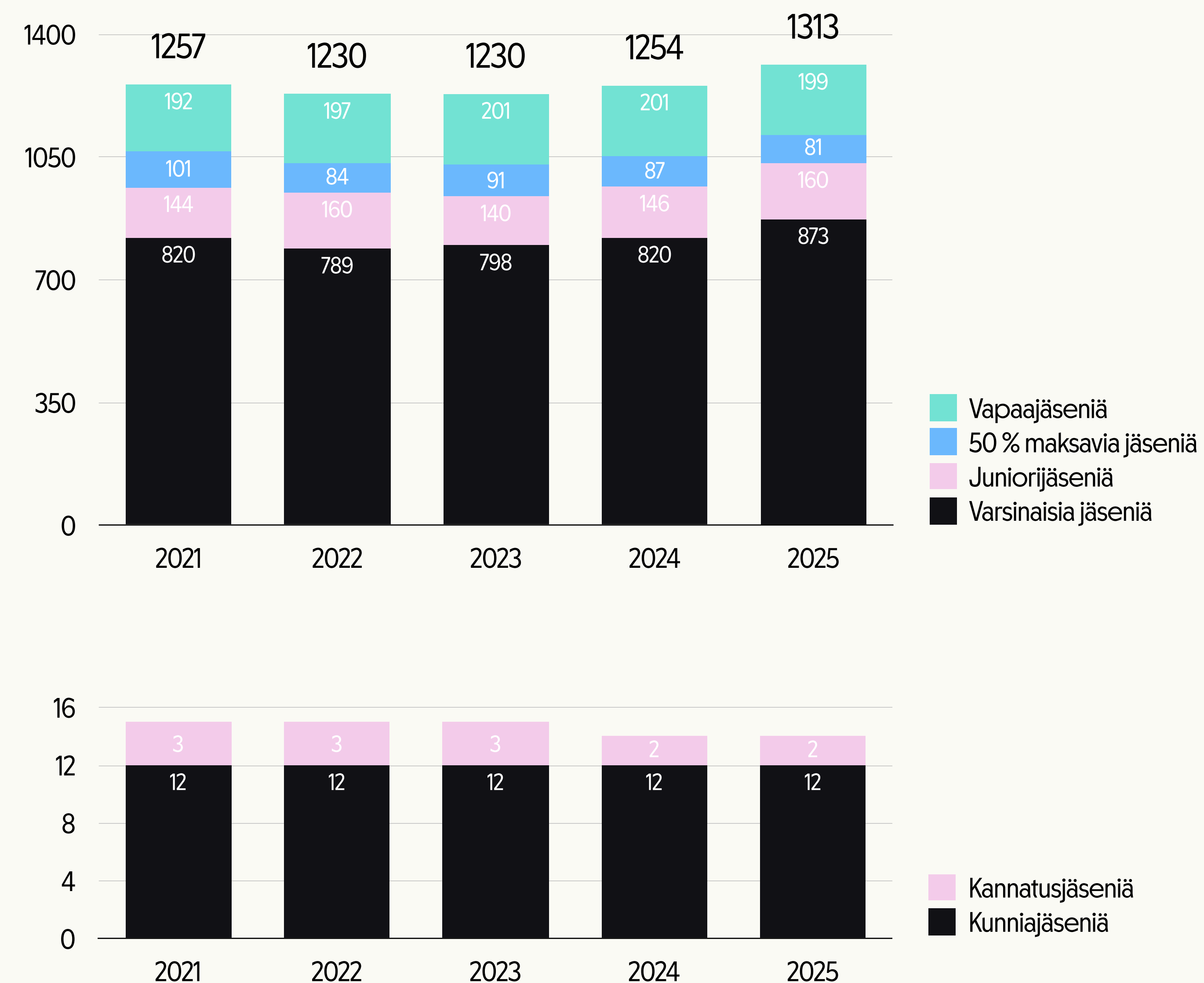
Grafian jäsenistö 2021–2025

Grafian jäsenten tavallisin ammattinimike on graafinen suunnittelija tai muotoilija (48 %), Art Director (14 %), kuvittaja (8 %) ja luova johtaja / suunnittelija (7 %). Muita ammattinimikkeitä ovat esimerkiksi UX-designer, informaatiomuotoilija, palvelumuotoilija, peligraafikko, kirjainmuotoilija ja sarjakuvantekijä.